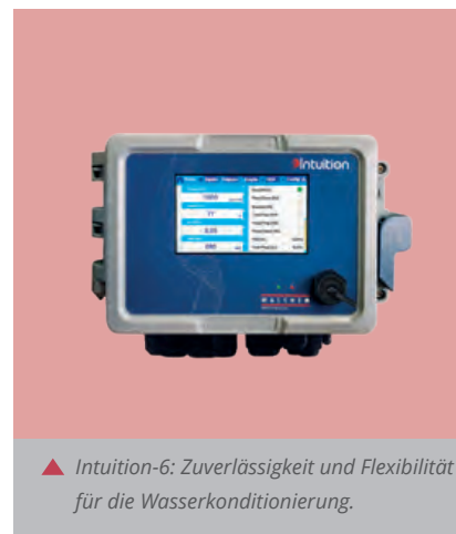
▲ Intuition-6: Zuverlässigkeit und Flexibilität für die Wasserkonditionierung.