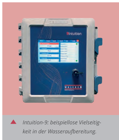
▲ Intuition-9: beispiellose Vielseitigkeit in der Wasseraufbereitung.