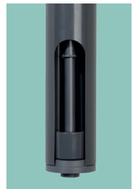
▲ Schwimmerschalter mit Wechselkontakten