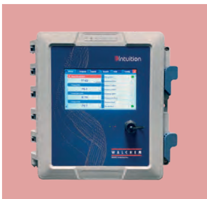
▲ Intuition-9: beispiellose Vielseitigkeit in der Wasseraufbereitung.