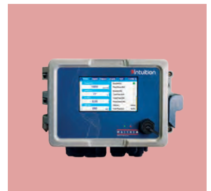
▲ Intuition-6: Zuverlässigkeit und Flexibilität für die Wasserkonditionierung.