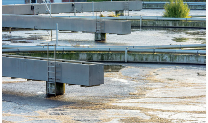
▲ Kläranlagen profitieren von gesenkten Verbrauchskosten bei der Schlammeindickung.

„ Wenn uns Komponenten-Lösungen nicht überzeugen, dann entwickeln wir eigene Marken.“